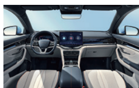
Blue and grey